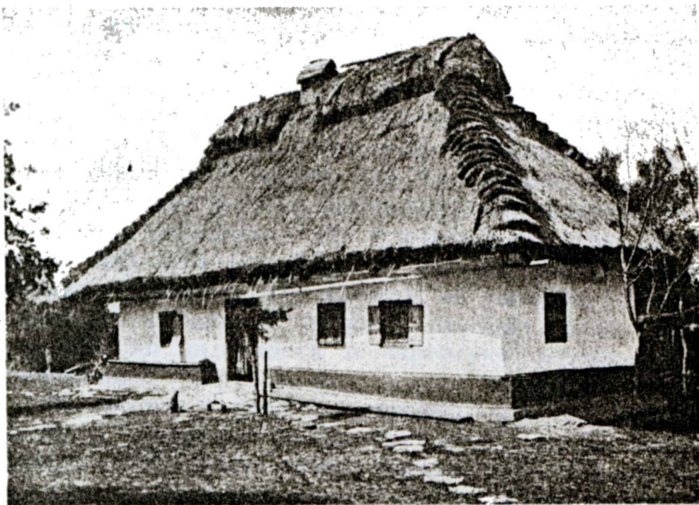
Хата в с. Студеном, 6. Ольгопольск. у.

ными узкими сторонами, как это типично для польских построек. В западной части, в селах, наиболее отразивших городскую культуру, встречаются, иногда в большом числе, так называемые «гипсованные» хаты, стены которых покрыты гипсом, при чем ровное поле стен разбито на части пилястрами с рельефными украшениями наверху. Если это явление и не слу-