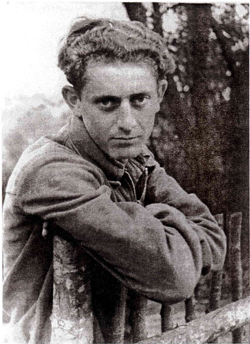
У археологічній експедиції в літописному Галичі (1951 р.)