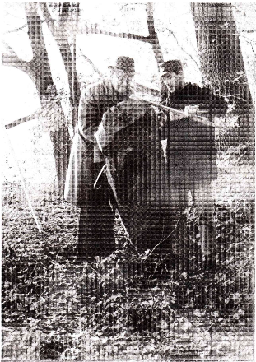
Обстеження місця розташування кам'яного ідола у Новоушицькому районі (1999 р.)