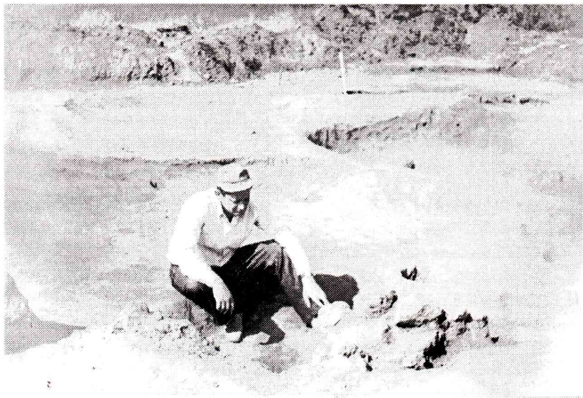
На розкопках в Бакоті (1977 р.)