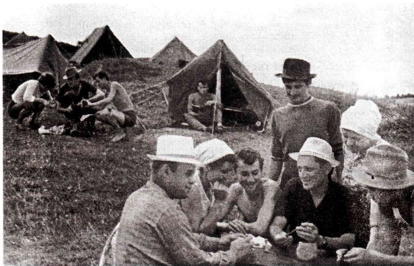
У таборі археологічної експедиції в Ружичанці (1965 р.)