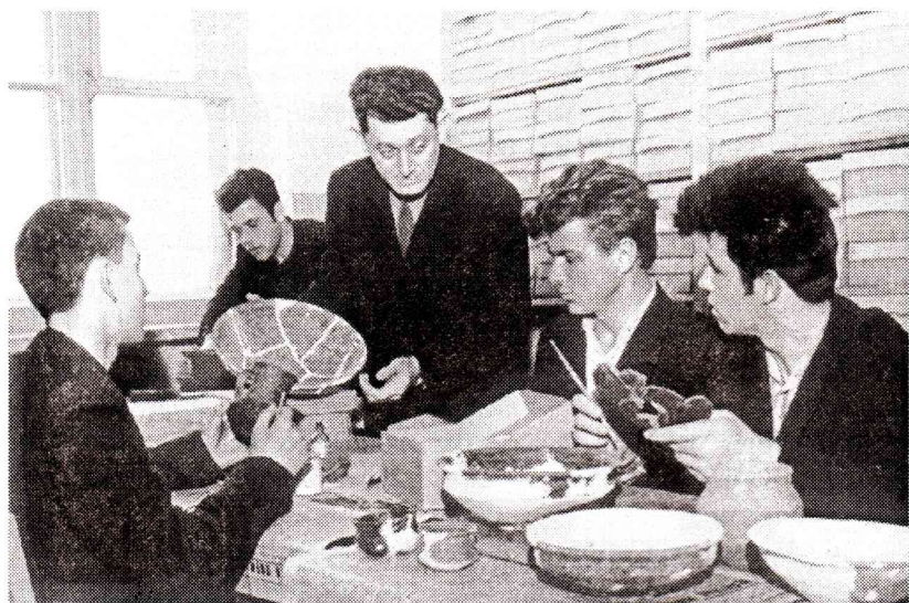
У археологічному кабінеті. Заняття з гуртківцями. (1966 р.)