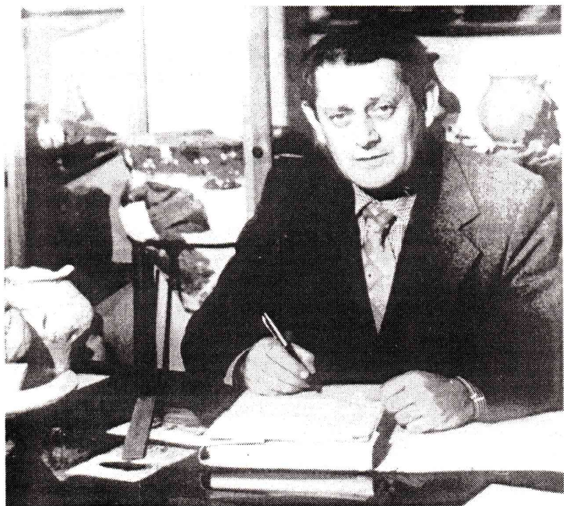
В кабінеті археології (1980 р.)