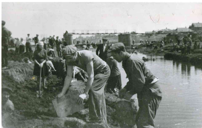
На будівництві водосховища, 1949-50 рр.