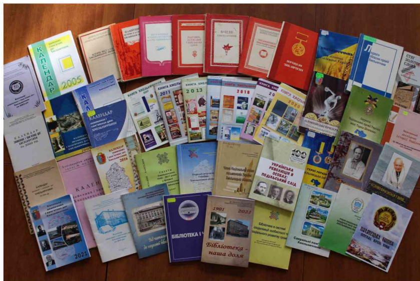
Видання Хмельницької ОУНБ