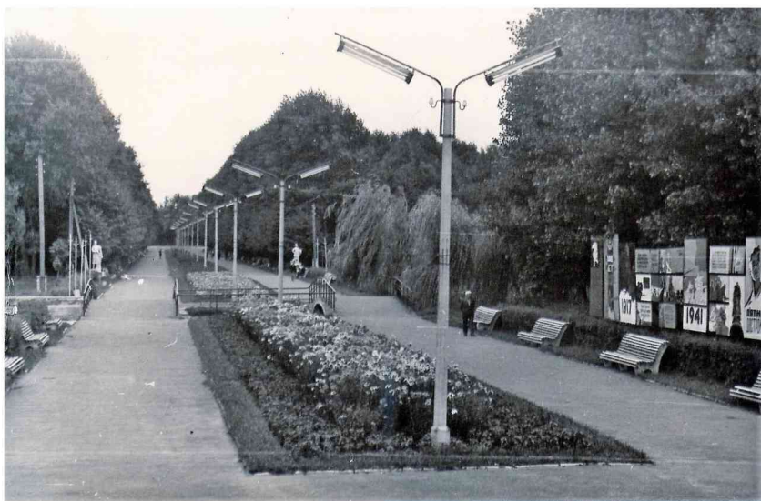
Центральна алея парку, 1968 р.