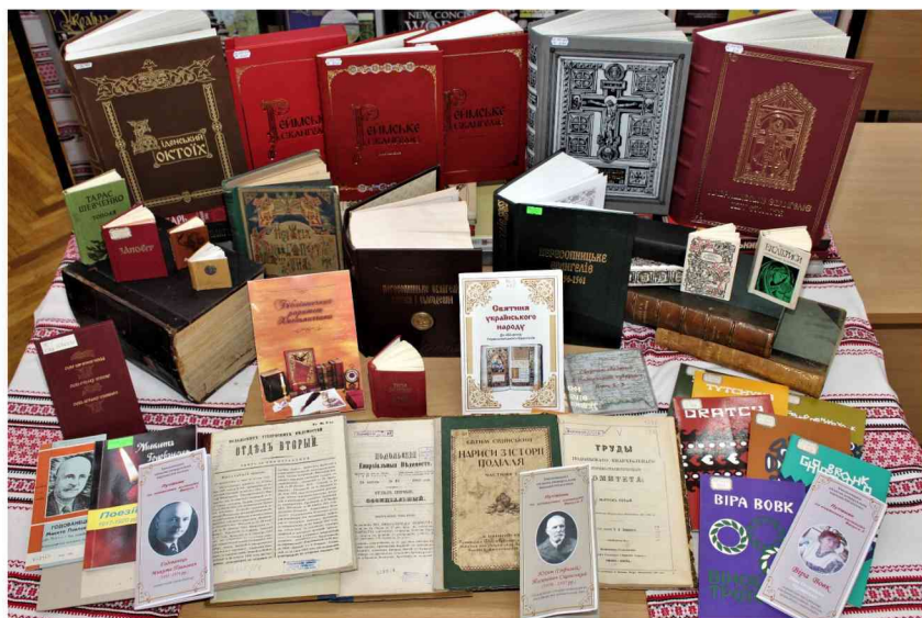
Бібліотечні раритети Хмельницької ОУНБ