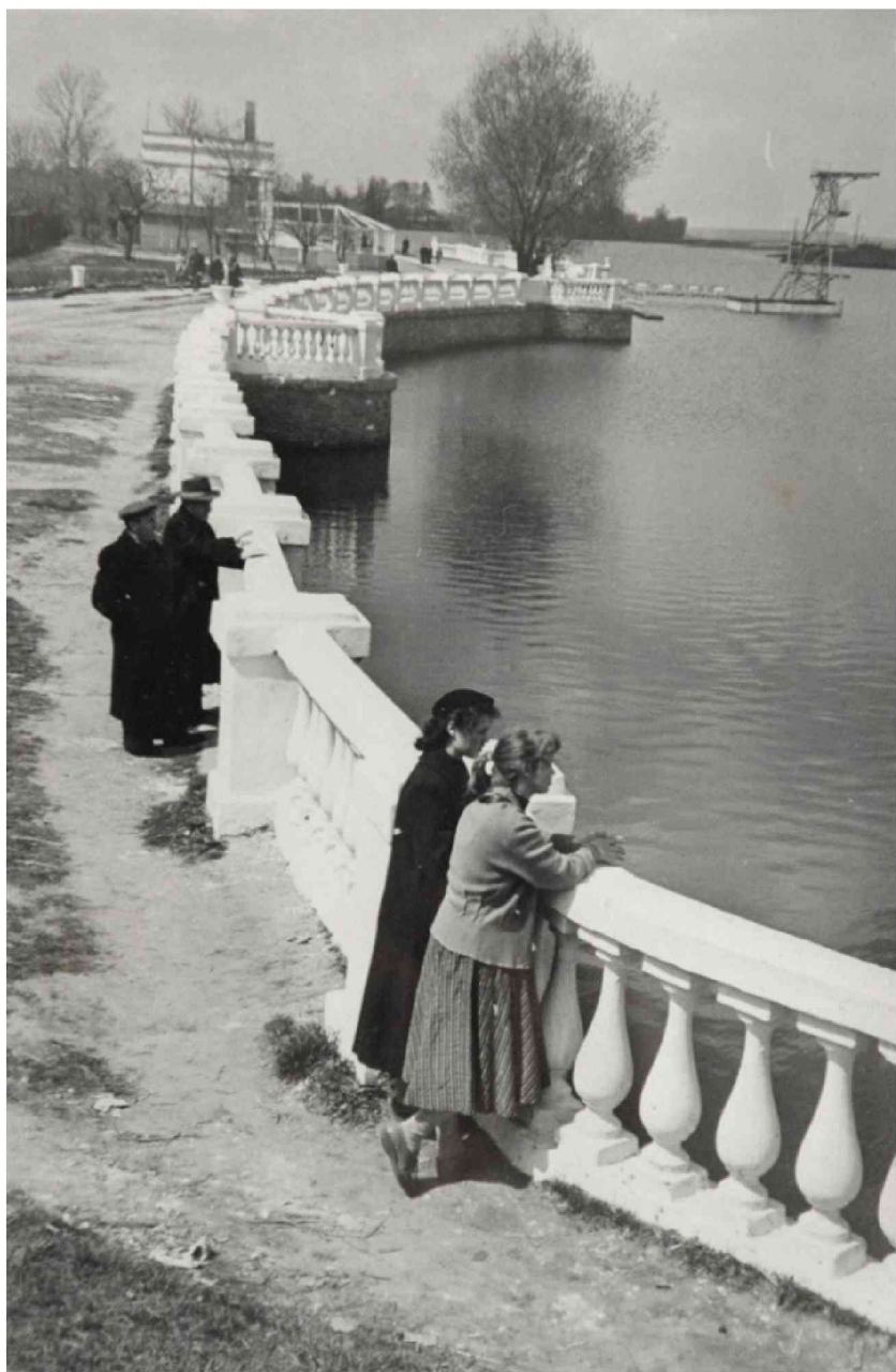
Набережна, початок 1950-х рр.