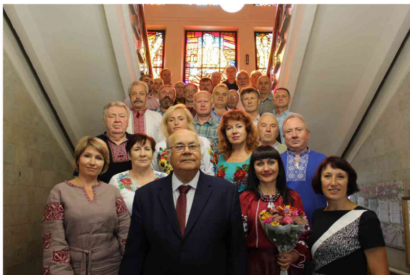
2018 рік. Учасники засідання клубу Краєзнавець Хмельницької обласної універсальної наукової бібліотеки