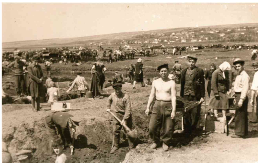
На будівництві водосховища, 1949-50 рр.