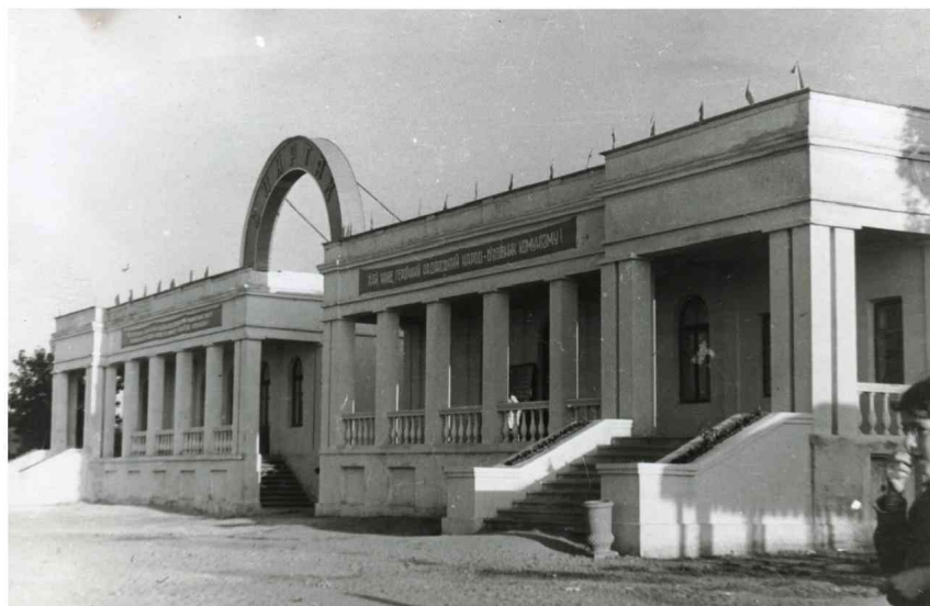
Водна станція, початок 1950-х рр.