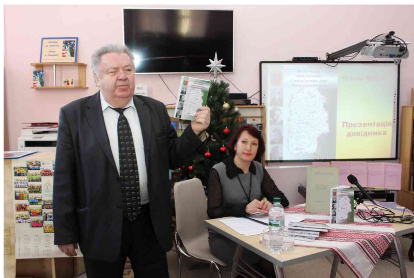
Презентація «Календаря знаменних і пам'ятних дат Хмельниччини» на 2020 рік.