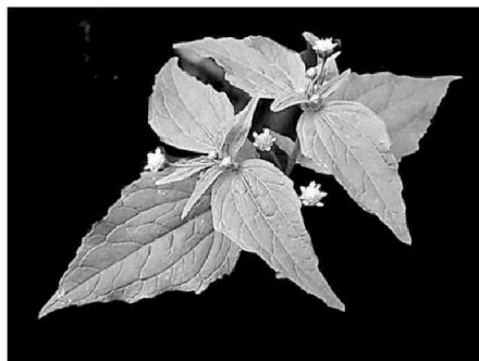
Рис.5. Галінсога дрібноквітка