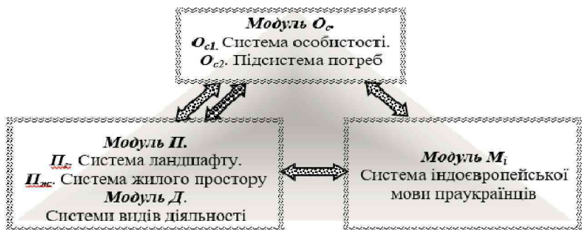
Мал. 1. Модель систем самоідентифікації за ознаками жилого простору та/або видів діяльності