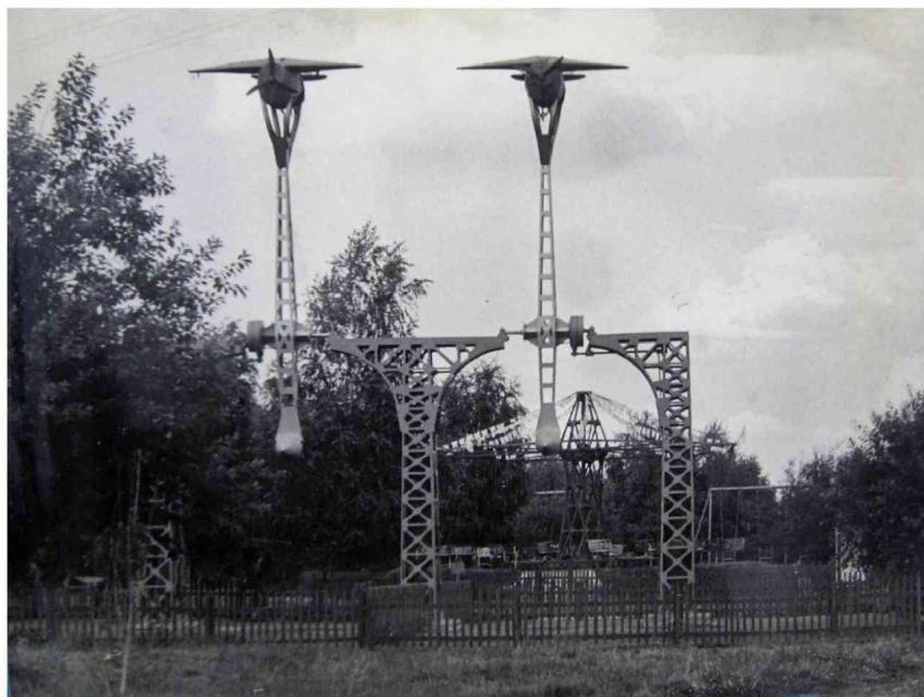
Один з перших атракціонів у парку – «Петля Нестерова», 1962 р.