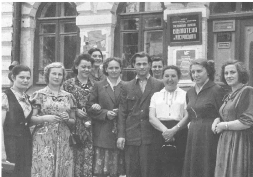
Колектив Хмельницької обласної бібліотеки. Кінець 50-х років.